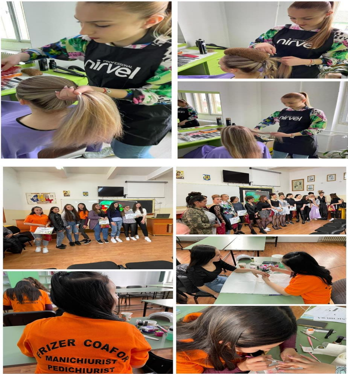
Participarea la Târgul Educației, organizat de către Inspectoratul Școlar Județean Arad