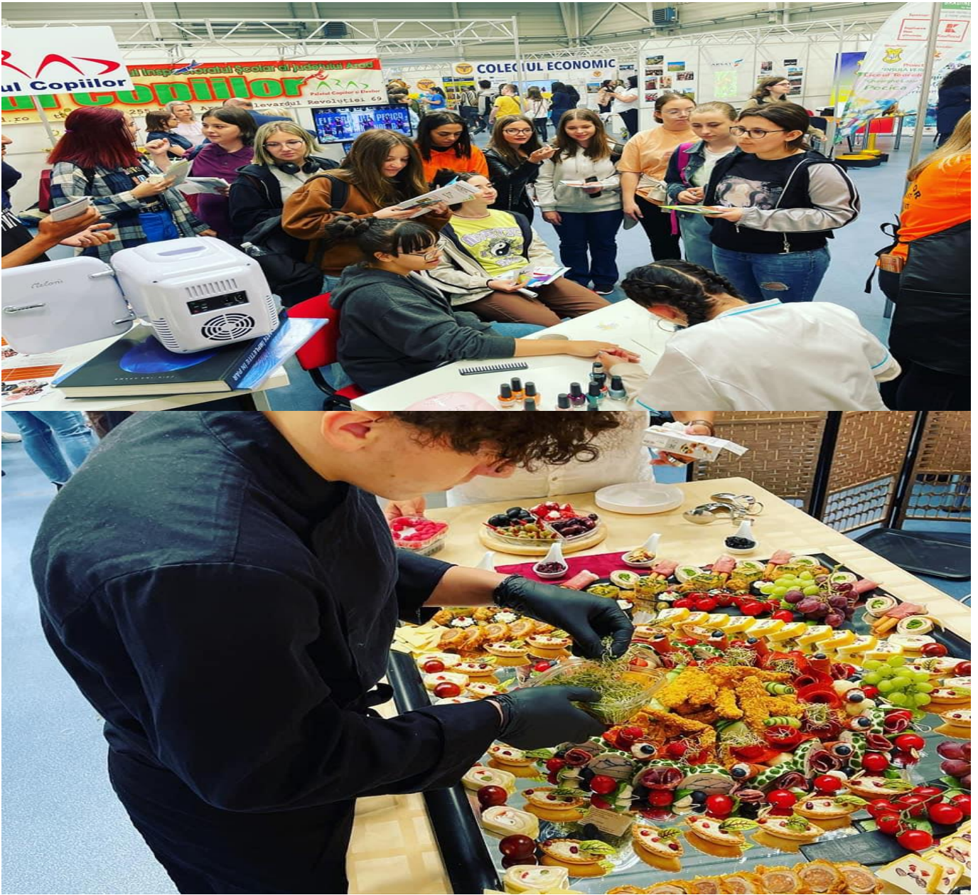
Examen de certificare profesională